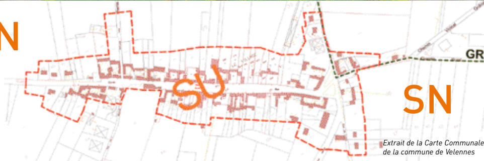
Extrait de la Carte Communale de la commune de Velennes