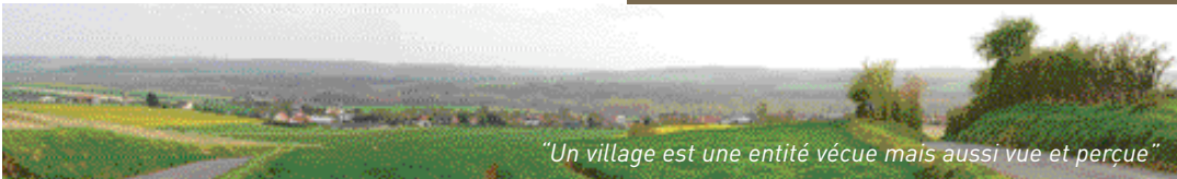
"Un village est une entité vécue mais aussi vue et perçue"