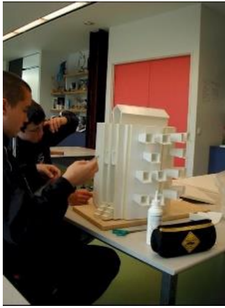
ATELIER DE SENSIBILISATION A L'ARCHITECTURE Collège Péronne

http://arts-plastiques.ac-amiens.fr/archives_arts-plastiques