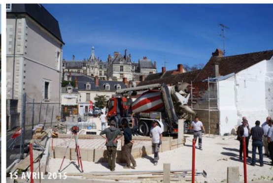
Le chantier mois par mois récit photographique chantier du Jardin public de l'Ormeau à Saint-Aignan-sur-Cher BIP arch. (CAUE 41)