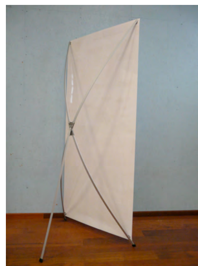
Structure autoportante par panneau