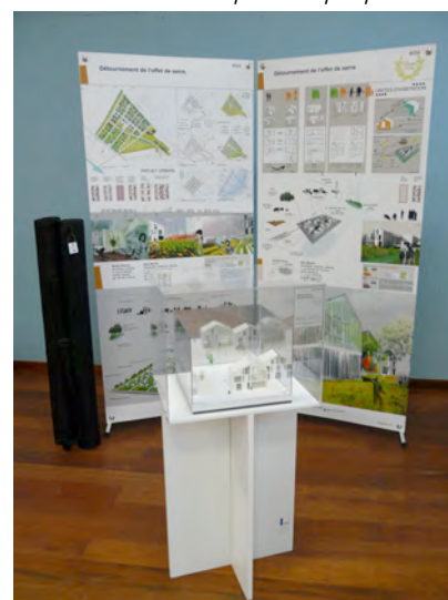
Éléments pour chaque projet présenté