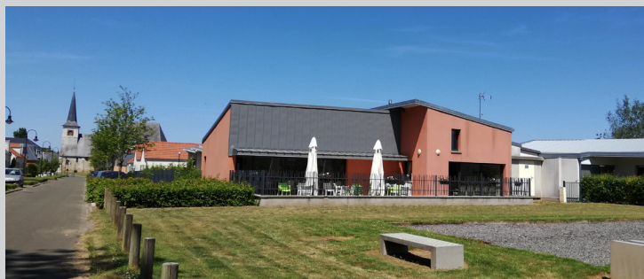
MARPA les Aïauts au centre de Feuquières-en-Vimeu (80) - Terrasse de la salle de restauration sur les aires de jeux de la place verte © Diversités architectes

L'architecture se pense à partir d'une analyse préalable du territoire dans lequel elle s'inscrit. Donc, l'étude a débuté grâce au Plan Local d'Aménagement de la commune mené avant le PLU. L'offre de logements pour les actifs pouvait se concrétiser par des constructions neuves mais aussi par un nombre considérable de logements de personnes seules et vieillissantes. En réalisant des logements neufs, petits et faciles à entretenir pour ces personnes en grande précarité, on a remis sur le marché immobilier des propriétés appropriées pour les jeunes et les actifs. La stratégie urbaine adoptée par les élus est de localiser le logement Séniors à la jonction entre le centre-bourg et le nouveau quartier, en lien avec une «place jardin» qui dessert les équipements de sports, de loisirs et une crèche.