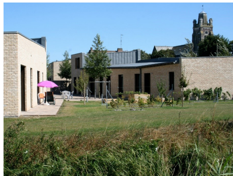
Béguinage, Vieille-Eglise (62) © Bernard architecte

C'est une approche ergonomique du corps dans l'espace : la hauteur des commandes et du mobilier, l'aire de retournement du fauteuil roulant ou du déambulateur, l'adaptation des sanitaires, entre-autres. Elle vise à adapter le cadre de vie et le bâti à la déficience physique et psychologique des usagers. Pour cela, elle différencie trois notions :