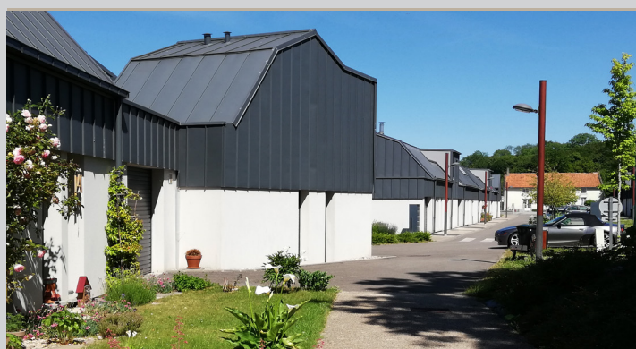
Béguinage, Saint-Riquier (80) © Katalan architecte

Résidence service Seniors Propriétaire ou locataire, intégrer un établissement privé et sécurisé de grande capacité proposant des services collectifs et individualisés.