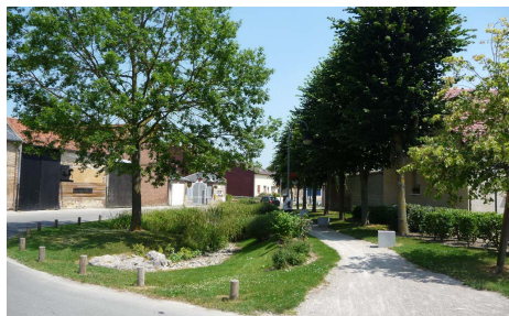
Aménagement de la place, Vaux-en-Amiénois (80)

- Poursuivre la revitalisation des centres-bourgs, en assurant les services de proximité et en facilitant leur accès grâce à des dispositifs de transport collectif dans le centre bourg et vers les villages alentour.