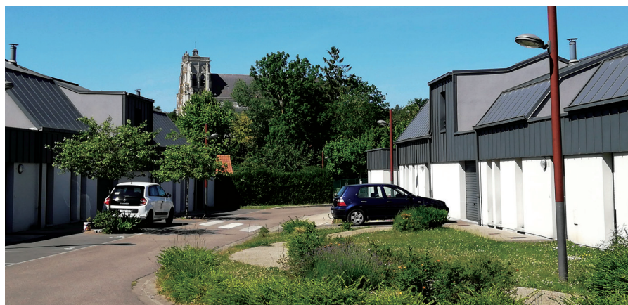
Béguinage pour Séniors au cœur de Saint-Riquier (80) © Katalan architecte

Ce Trait d'Union fait suite à ceux de 2019 qui illustraient des opérations villageoises de logements intergénérationnels ou dédiés aux Séniors. Il constitue un volet de l'action du CAUE sur ce thème, enrichi d'un voyage d'études prévu en 2021.