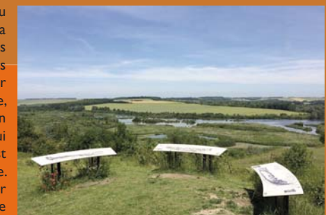
L'un des belvédères de la Somme, celui de Frise