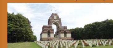
Mémorial franco-britannique de Thiepval

72205 noms de soldats britanniques et sud-africains disparus sont inscrits sur cet imposant monument de 45 mètres de haut.