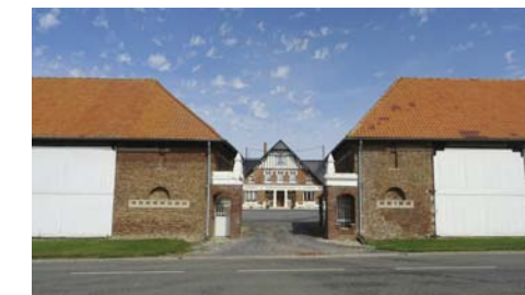
Corps de logis de style néo-normand

Les matériaux traditionnels de construction pour les bâtiments agricoles (torchis) seront délaissés au profit de la brique. Le Ministère de l'agriculture diffusera des plans de reconstruction afin de favoriser le modèle ancien de cour fermée. Ce modèle sera largement suivi. Cependant, on trouve également des reconstructions monumentales isolées sur des parcelles dans les plaines.