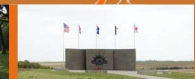
Mémorial de Le Hamel

Les cinq drapeaux de ces nations s'élevant battues pour la liberté de l'Europe flottent fièrement sur les anciens champs de bataille.