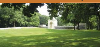
Mémorial sud africain de Longueval

Un arc de triomphe, un cénotaphe, un musée et un cimetière militaire composent ce mémorial érigé en l'honneur des soldats sud-africains.