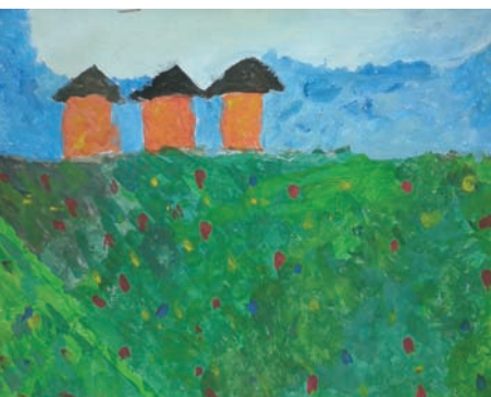
Les Hardines de Péronne, dessin à la gouache Regarder le paysage du quotidien, découvrir des œuvres exceptionnelles, les commenter, les représenter.

Plus d’infos sur le net : www.payshautesomme.fr