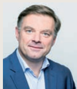
Madame, Monsieur, Chers adhérents,

Le développement des actions pédagogiques constitue, depuis plusieurs années, un des enjeux prioritaires pour le CAUE de la Somme.