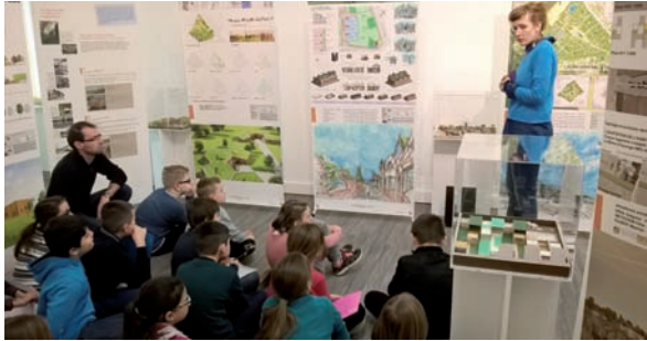
Découvrir des projets et des réalisations contemporaines

Pour les élèves, chaque rencontre a été un moment privilégié de découverte, dans et hors de la classe et avec des professionnelles à leur écoute. Tous ont été motivés par ce projet et se sont réellement investis. Chaque échange a été un moment de création et de surprise, cela a permis aux élèves d’acquérir une partie du socle commun de connaissances, de compétences et de culture. Ils ont été très sensibles à l’échange continu d’idées sous des formes variées : le travail par la manipulation, la réflexion et les échanges entre eux qui permettent à chacun d’être acteur de son apprentissage et de lui donner du sens.