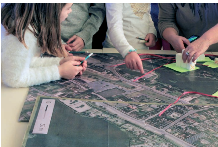
Imaginer une maison, un jardin, un paysage du XXI e siècle à Péronne Lycée, écoles et maison de quartier, 2017

Enfin, la dernière partie illustrera dans quelle mesure, un lieu, le collège de Rivery, dans lequel les collégiens vivent et apprennent peut aussi devenir, en soi, un véritable outil pédagogique.