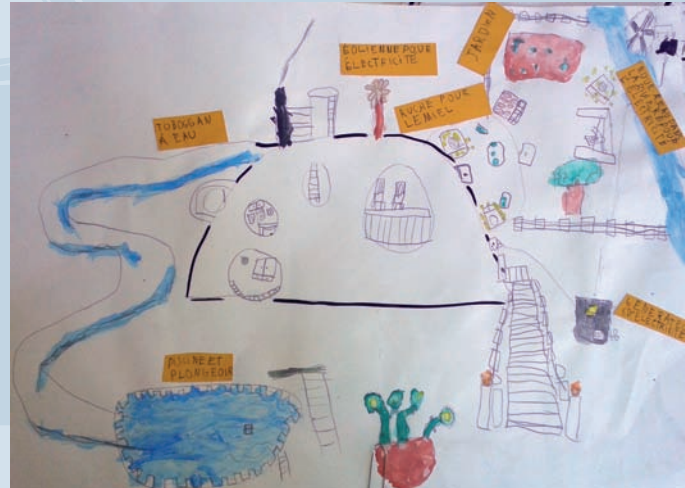
Maison sur les remparts, coupe au crayon et collages

dans les champs sans se soucier de l’argent. Ces champs-là seraient autour de toutes les jolies habitations. Dans les jardins, de jolies fontaines dont l’eau serait potable donneraient un joli calme. Ce serait vraiment bien si tous les assassins voyaient les beautés de notre monde”.