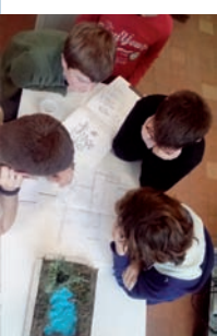
Les étangs de Péronne, dessin à la gouache

Cette année par exemple, des enseignants d'arts plastiques, de sciences physiques et de sciences et vie de la terre ont permis de compléter la maquette virtuelle d'un abri de jardin écologique réalisée en cours de technologie. Ils ont contribué au projet en amenant les élèves à proposer une solution qui procure des émotions, qui est plus économe en énergie, ou qui gère au mieux l'eau. Ces supports concrets ont favorisés les échanges au sein même des équipes d'élèves et facilité les synthèses qui en découlaient.