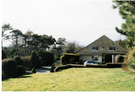
«Exploiter l'implantation dans le terrain et la dimension des volumes pour optimiser les espaces extérieurs, les orientations et les vues favorables».

L'exposition est une invitation à la découverte d'une dizaine de maisons en images, avec des messages destinés à guider, sensibiliser le visiteur à la qualité de l'architecture et à la qualité de vie qu'elle apporte à ses habitants.