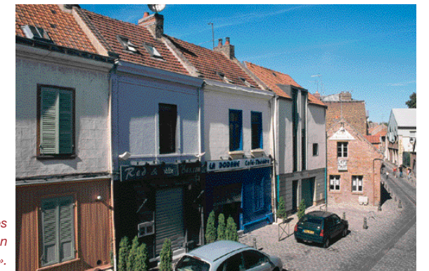
«Optimiser les contraintes d'un site difficile».