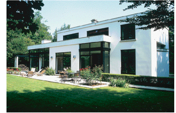
«Vivre à 100% au rez-de-chaussée, dans un espace ouvert, avec quelques chambres un peu isolées».