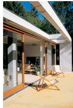
«S'ouvrir au maximum sur l'extérieur tout en conservant un intérieur confortable et protégé».