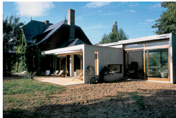
«Opter pour une architecture contemporaine tout en respectant l'architecture existante».