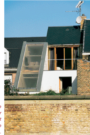
«Exploiter l'espace intérieur pour apporter confort et lumière dans une petite parcelle».

Chaque maison est présentée dans son environnement : le paysage bâti ou naturel dans lequel elle s'insère, elle dialogue ou elle contraste avec sens, comment elle profite des vues ouvertes sur l'horizon ou cadrées sur un coin de jardin, comment elle est orientée pour bénéficier de l'ensoleillement, se protéger des surchauffes estivales ou profiter de la chaleur du soleil de l'hiver.