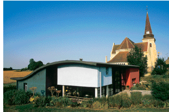
«Exploiter le relief, la dimension et l'orientation des volumes, les couleurs, les matériaux pour adapter la maison à son paysage».