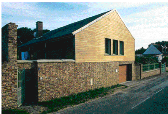
«Reconvertir un bâtiment utilitaire tout en créant une maison agréable».

Elle donne un aperçu, au-delà des a priori, de ce que l'on peut aussi faire en matière d'habitat dans notre région.