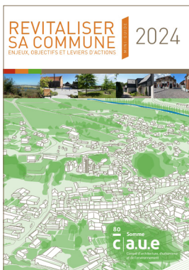
Revitaliser sa commune – Enjeux, objectifs et leviers d'actions – 8 p. 2024 – CAUE 80

Le Centre de ressources du CAUE de la Somme offre un accès documentaire avec la possibilité d'emprunt : ouvrages, guides, études, revues.