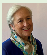
Madame, Monsieur, Chers adhérents,

Cette publication consacrée aux ateliers « Revitalisation » du CAUE vous invite à découvrir cette offre de conseil que nous menons depuis 2023.