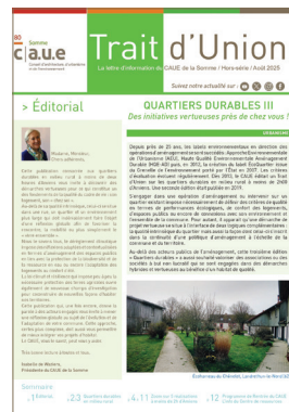
Trait d'Union #31 HS – Quartiers durables III : Des initiatives vertueuses près de chez vous ! 8 p. – 08/2025 – CAUE 80