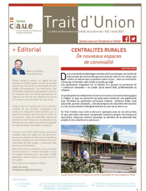
Trait d'Union #20 – Centralités rurales – De nouveaux espaces de convivialité – 4 p. – 09/2021 – CAUE 80

Rédaction : Grégory Villain, Directeur ; Gaël Quelin, Assistant-chargé d'études en urbanisme